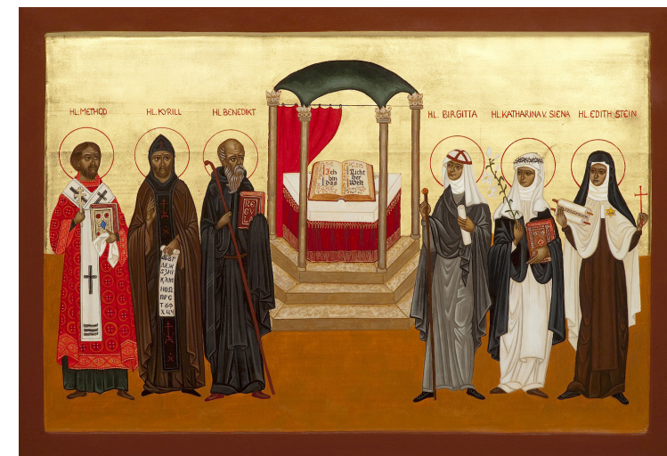
Ikone von Hildegard Roll zu den Patronen Europas, mehr dazu www.renovabis.de/ patrone-europas