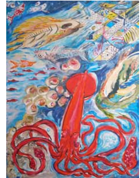
Bei diesem Bild handelt es sich um ein Gemeinschaftswerk verschiedener AMOS- Künstler als verantwortlich zeichnet Andrzej Estko